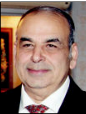
إعداد د. أحمد سامح