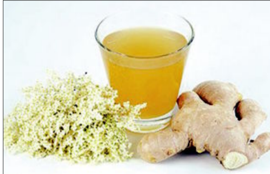
مشروب الزنجبيل يحمي من أمراض الجهاز التنفسي ويقي الفحولة