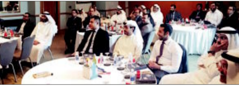
المشاركون في البرنامج التدريبي

والتنسيق بين مختلف قطاعات وإدارات العمل. وأكدت أن الشركة ترى في التطوير والتحسين المستمر أداء العاملين فيها، الطريق الأمثل إلى الريادة والتقدم المستمر، وأكدت تقديرها للموظفين الذين يقدمون قيمة مضافة لعملهم ويسعون باستمرار إلى خدمة أهدافها بالتعاون مع زملائهم، ليصبح العمل الجماعي والتقدير والثقة أهم ما يميز العاملين لديها.