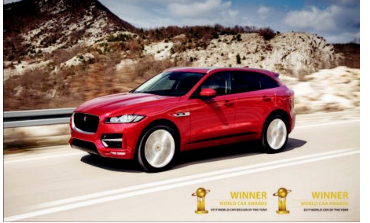
أداء بارز يحظى بثقة الخبراء

سيبث: قدرات استثنائية لسيارة الدفع الرباعي فائقة الأداء