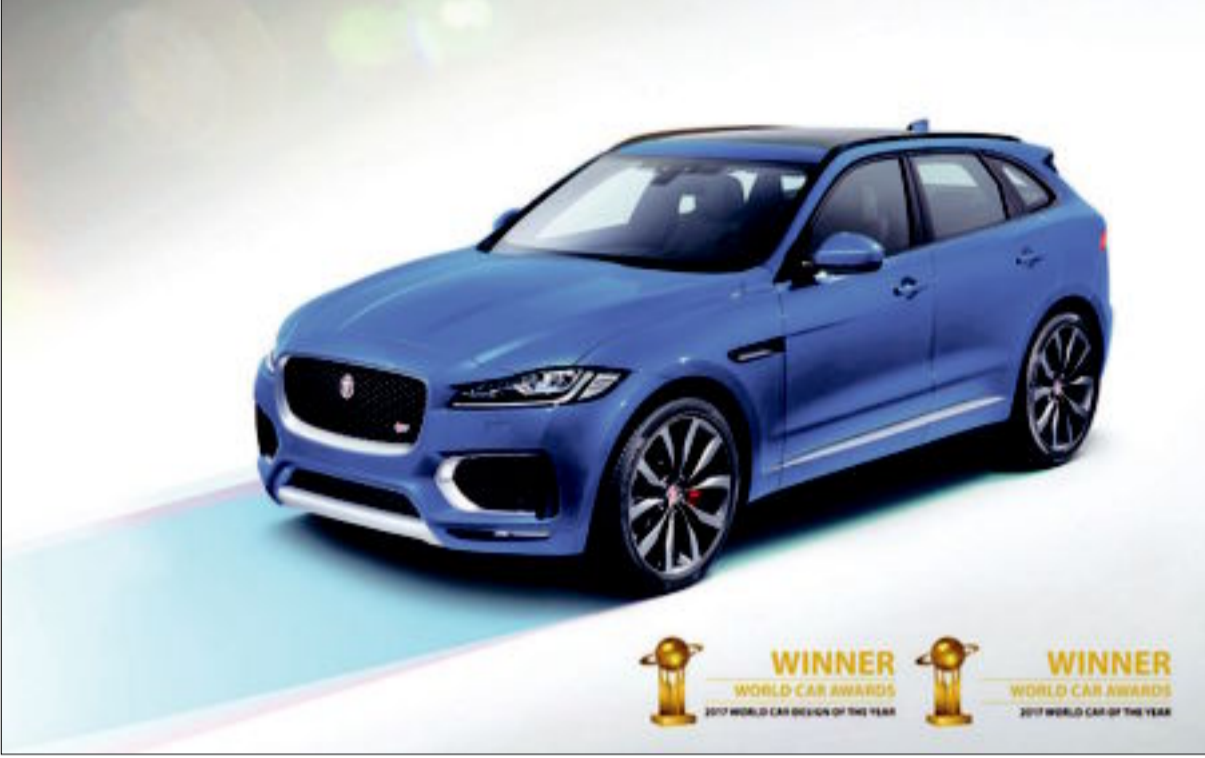
إنجاز جديد في سجل «جاكوار»