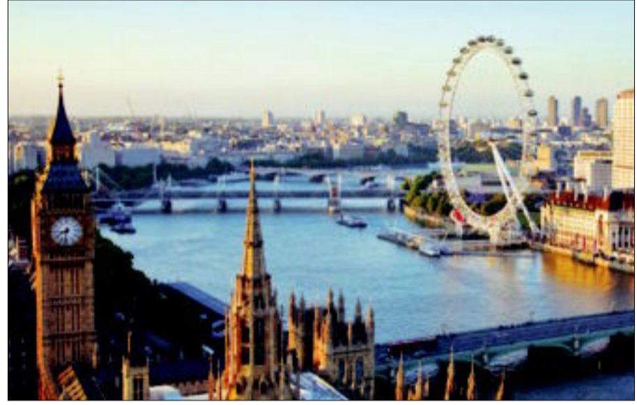
خدمات مبتكرة للتعريف بـ «عاصمة الضباب»