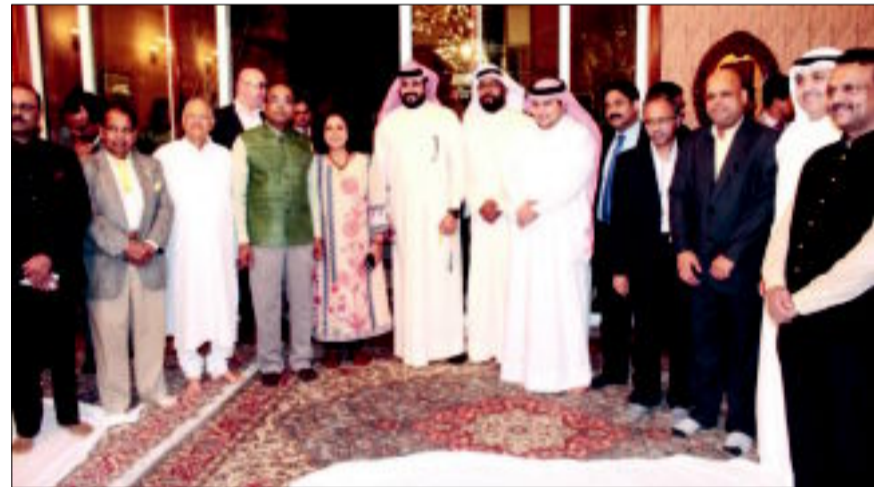
السفير جين وجرمه يتوسمان الحضور

مميزة في الكويت نظرا لترايط المجتمع الكويتي والحرص المتبادل على اللقاءات لقضاء السهرات الرمضانية في أجواء من الود والمشااعر الطيبة.