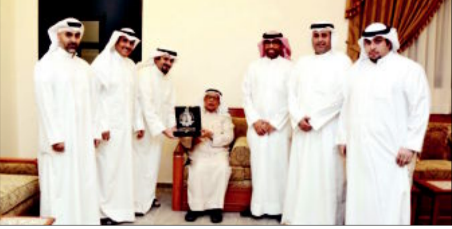
درع تذكارية من النادي العلمي للعجيري

إضافة إلى اقربه من خط الاستواء فمن خلال السماء الجنوبية يمكن رؤية ما لا يراه أهل أوروبا. بدوره ضمن أمين عام النادي العلمي له على الجمعة الدور الذي قام به عالم الفلك الجليل الدكتور صالح العجيري على مدى أكثر من 35 عاماً من التعاون المستمر لافتاً إلى ان زيارة ممثلي النادي العلمي له في العشر ليالي الأواخر من رمضان تأتي في إطار التعاون المستمر والبناء في ما بين النادي ورئيسه الفخري والذي له كان الدور الأساسي في انشاء مرصد العجيري. وقال الجمعية ان فكرة انشاء المرصد جاءت في العام 1980 ورات العام 1986 وذلك من خلال تعاون النادي العلمي ومؤسسة الكويت للتقدم العلمي ليحصل المرصد اسم العالم الفلكي الدكتور صالح العجيري تقديراً للدور البارز الذي قام به لخدمة بلده في مجال علوم الفلك وللمكانة الكبيرة التي احتلتها على مستوى الكويت والوطن العربي.