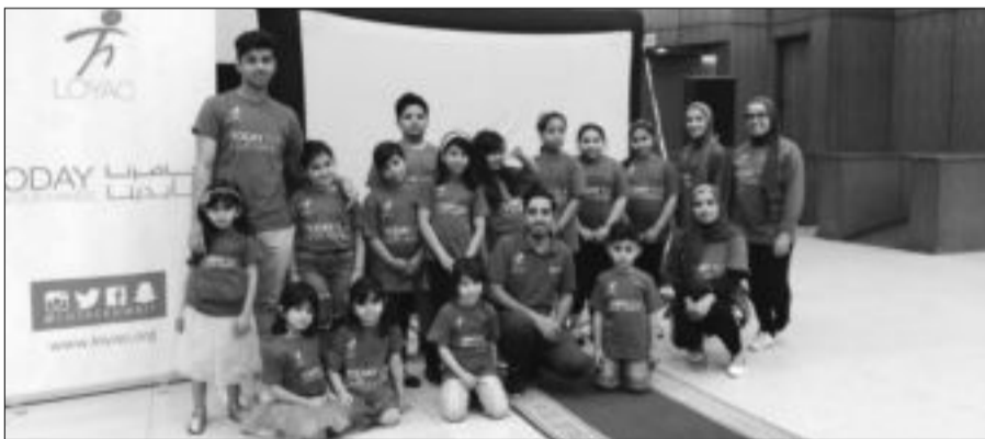
دعم الأطفال والشباب