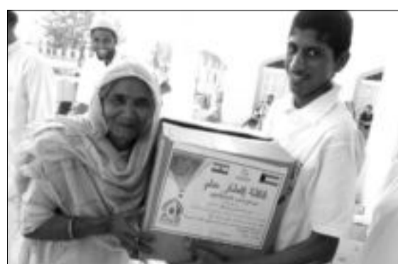
كرتونة إفطار صائم