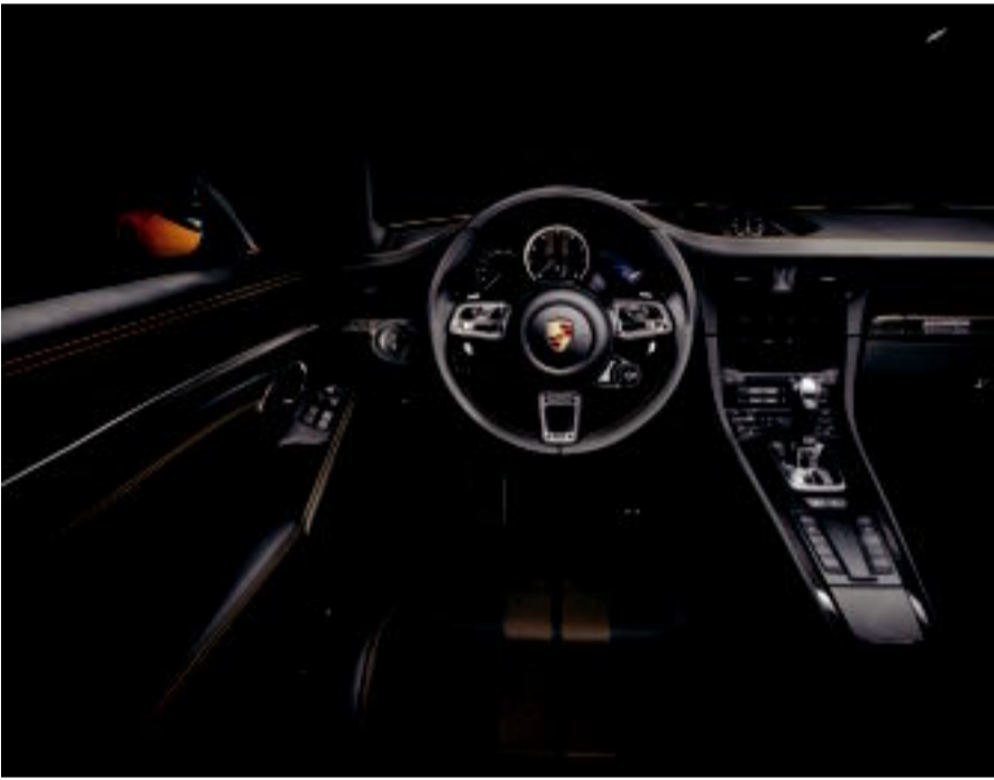
تفاصيل ذكية داخل المقصورة