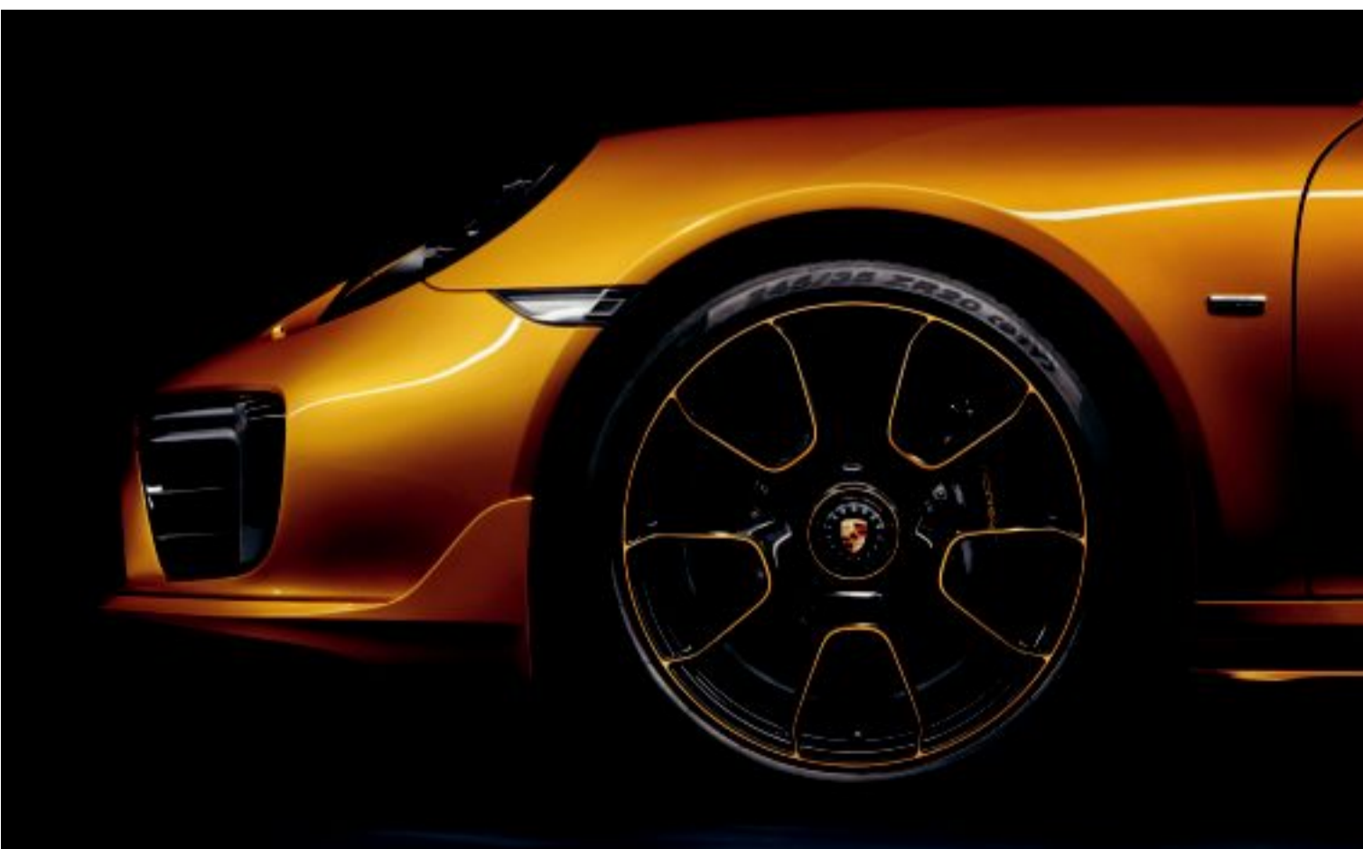
عجلات قوية تعزّز مرونة القيادة

ويبدأ ثمن التجزئة لطراز «911 توربو إس إكسكلوسيف سيريز» الجديد بمبلغ 72700 دينار في الكويت، وقد توافر للطلب بدءاً من 8 يونيو الجاري.