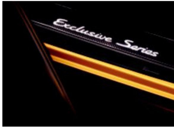
تمييز العملاء على الدوام